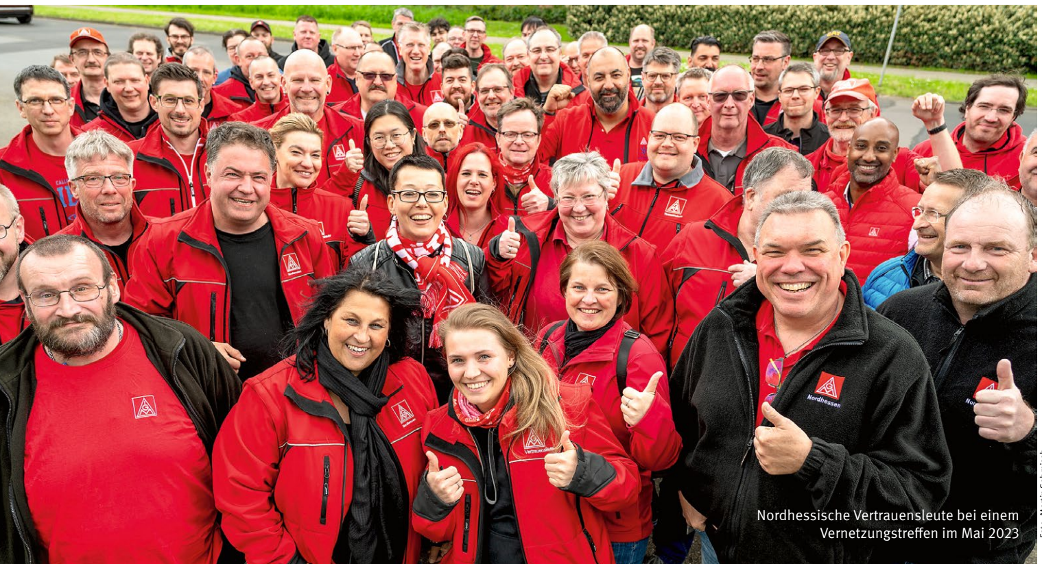
Nordhessische Vertrauensleute bei einem Vernetzungstreffen im Mai 2023