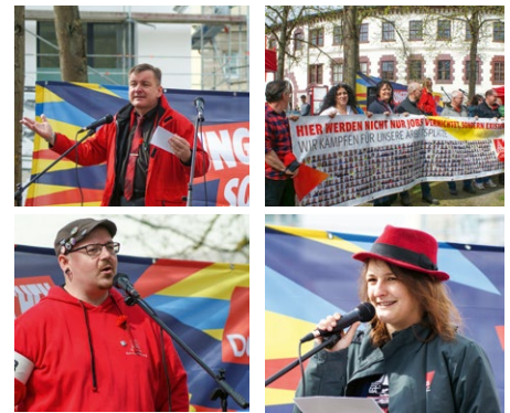
1. Mai in Meiningen