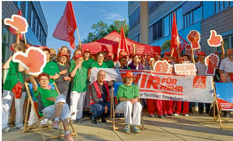
Gemeinsamer Warnstreik von CWS-Boco und AlSCO am 12. Juni 2023

Bitte merken! Das Sommerfest der IG Metall Frankfurt steigt am 14. Juli ab 15 Uhr auf dem Parkplatz beim DGB-Jugendclub hinter dem Frankfurter Gewerkschaftshaus.