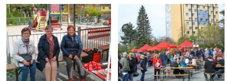
1. Mai in Suhl