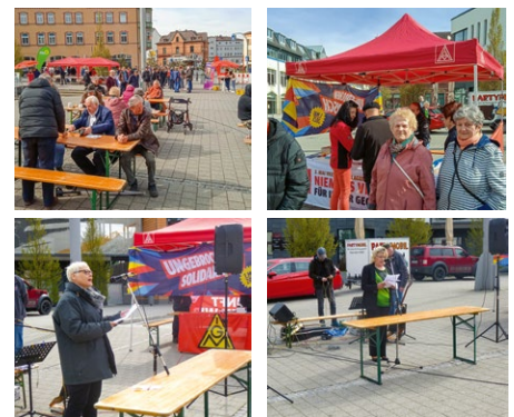
1. Mai in Sonneberg