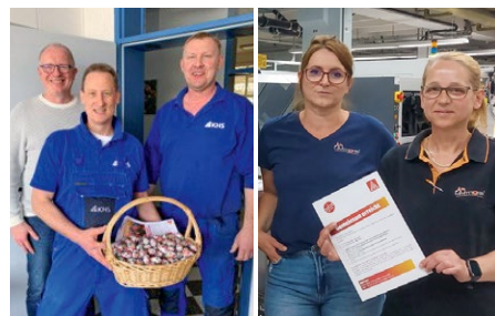
Aktionen zur Kommunikation des Tarifergebnisses bei KHS und Limtronik