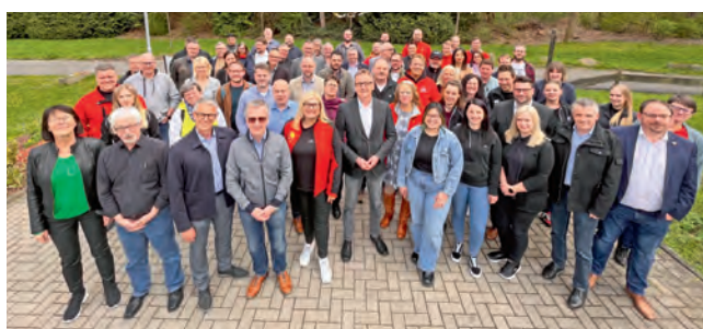
Die Delegierten des Bezirks Mitte

Der Gewerkschaftstag findet vom 22. bis zum 26. Oktober 2023 in Frankfurt am Main auf dem Messegelände statt.