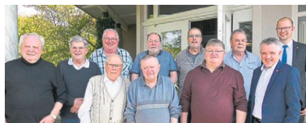
Jubilare aus der Region Birkenfeld/Idar-Oberstein